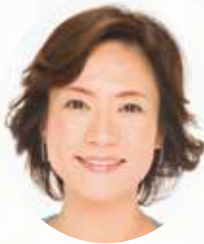
参議院議員 たかがい 恵美子

初秋の候、埼玉県看護連盟の皆様におかれましては、ますますご清祥のことと存じます。平素より、国民福祉の向上と看護政策の推進にご尽力を賜り厚く御礼申し上げます。お陰様で、当選来一貫して社会保障制度改革の重要な任にあたらせていただくとともに、一昨年秋より女性局長を2期務めさせていただきました。先の参院選を経て、党所属女性国会議員数は43名となり、地方議会においても女性議員数が493名となりました。女性版ふるさと対話集会の創設と全国展開、政治女子を育てる党政治塾「プレミアム・ウィメンズクラブ」の創設・開講、女性の健康の包括的支援に関する法案成立への取り組み、女性医療職エンパワメント推進議連の創設と、着実に政策提言を進めています。