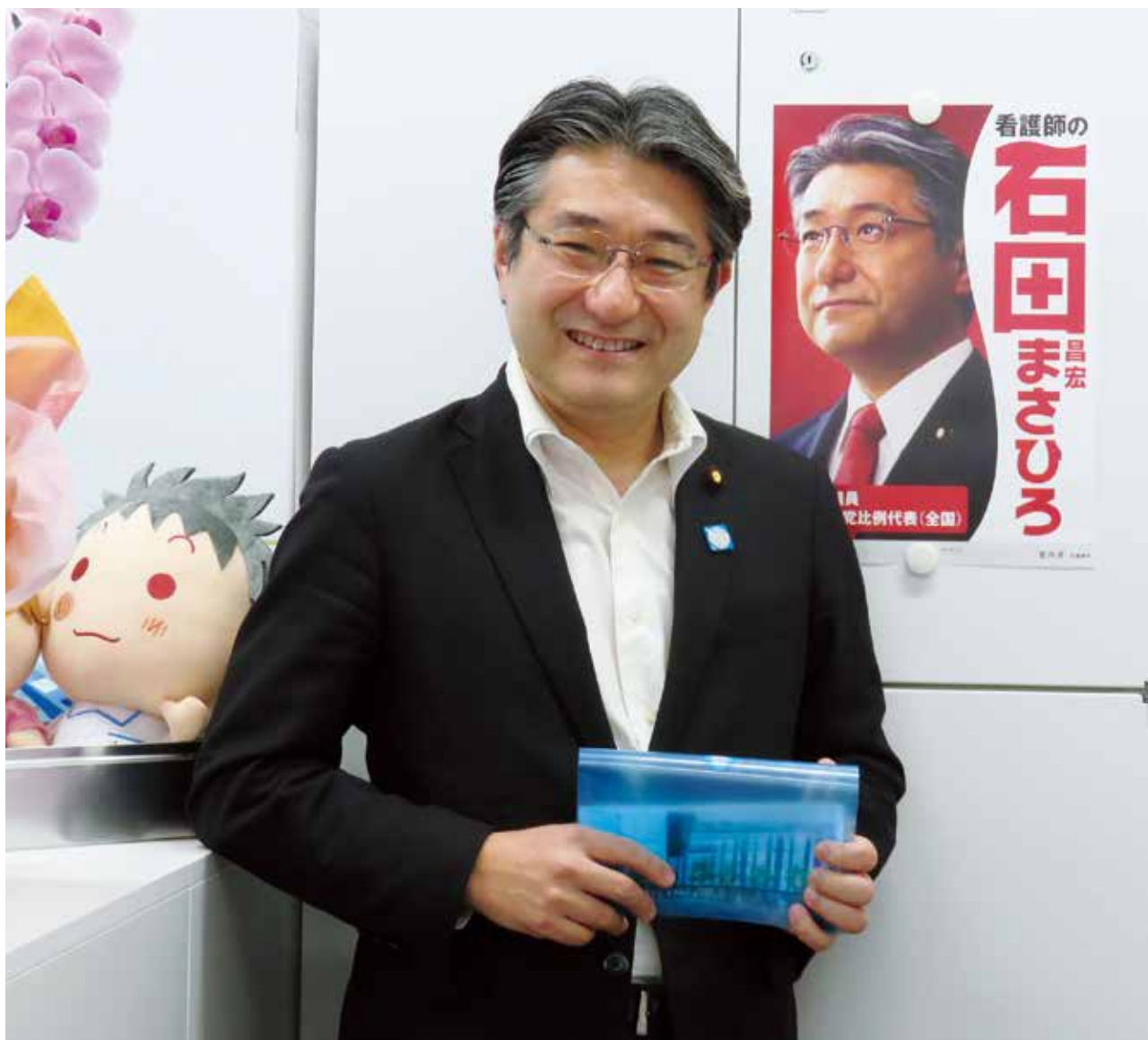
埼玉県看護連盟を訪れました