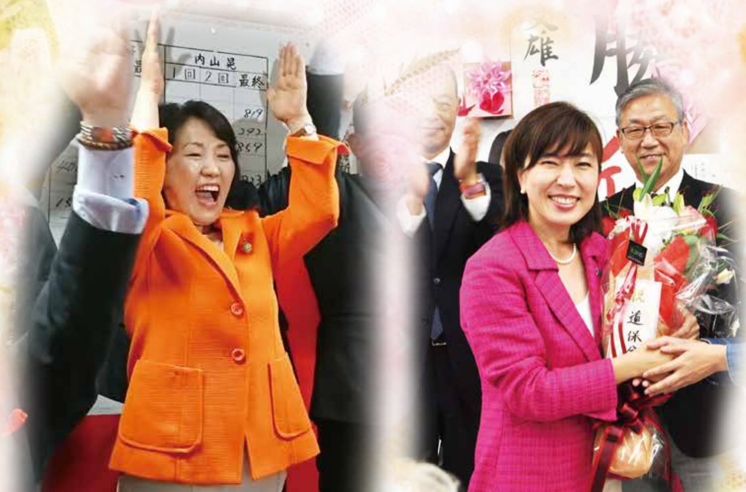
岡山3区 あべ俊子議員